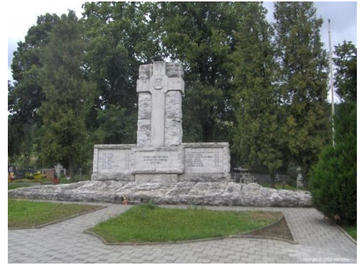
Pomník udalostiam v Černoveji