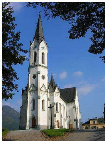
Súčasná podoba kostola, ktorý bol príčinou tragédie v Černovej

Žandári dostali príkaz dedinčanov ....., čoho dôsledkom bolo ..... na mieste, ďalších ..... podľahlo zraneniam neskôr. Na ulici pred kostolom ostalo aj množstvo zranených. Úrady po incidente ..... ešte ďalších ..... osôb za účasť na tejto udalosti.