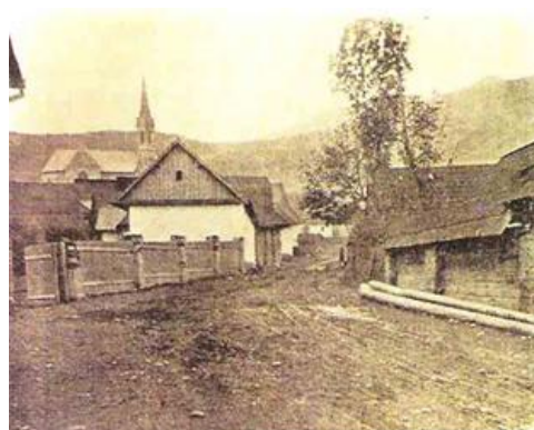
Ulička v Černovej, na ktorej sa odohrala tragédia

Ten určil, že nový kostol vysväti ..... , ktorý prišiel na vysviacku do Černovej v sprievode ..... Vysviacka sa mala uskutočniť za ....., aj bez súhlasu občanov. Černovčania chceli tomu ....., tak sa zhromaždili pred dedinou, do ktorej nechceli pustiť svätiakeho kňaza a hlučne prejavili svoj ..... s konaním biskupa.