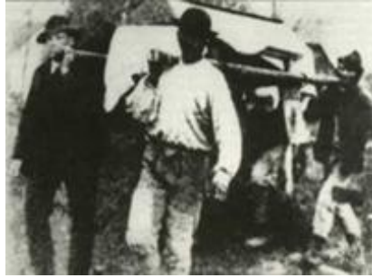
Jeden z 15 pohrebov obetí Černovskej tragédie

Björnstjerne Björson bol nórske dramatikom a nositeľom Nobelovej ceny za literatúru, ktorý tiež zareagoval na udalosti v Černoveji. Po informáciách o udalostiach na Slovensku začal masívnu kampaň proti uhorskej vláde s požiadavkou ukončenia maďarizácie. V. Šrobárovi pri tejto príležitosti napísal: „ Sám sa chcem pokúsiť vypáliť krvavé znamenie na chrbát maďarských vodcov. “