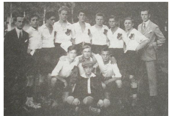
Prešovský futbalisti z klubu ETVE Prešov v roku 1920