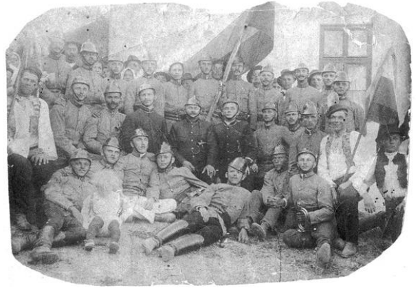
Dobrovoľní hasiči z obce Horné Orešany zo začiatku 20. storočia