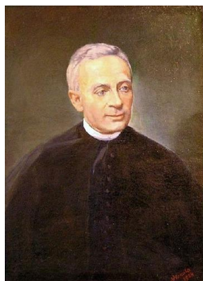
Zakladateľ Spolku sv. Vojtecha - Andrej Radlinský