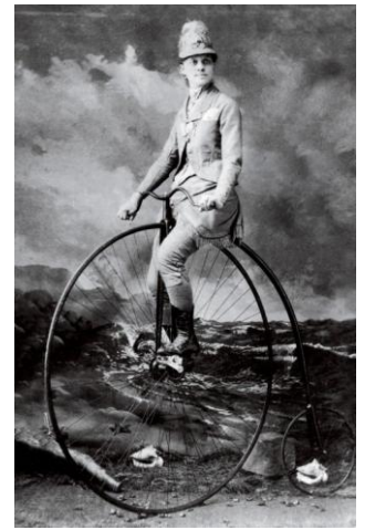
Cyklistka zo začiatku 20. storočia

Moderný životný štýl sa však bohužiaľ spája prevažne s životom. Nové prvky modernosti sa na vidiek buď nedostali, alebo dostali len s vážnymi ťažkosťami a obmedzeniami. Príčinou bol fakt, že slovenská dedina žije aj na začiatku 20. storočia spôsobom života, ktorý bol silne