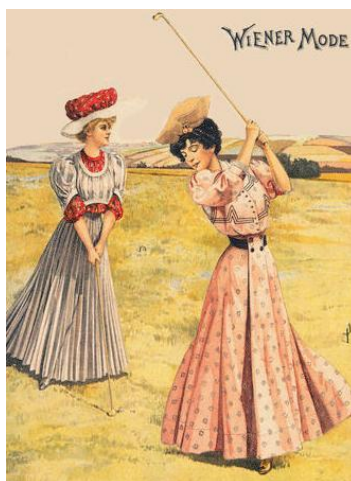
Móda zo začiatku 20. storočia