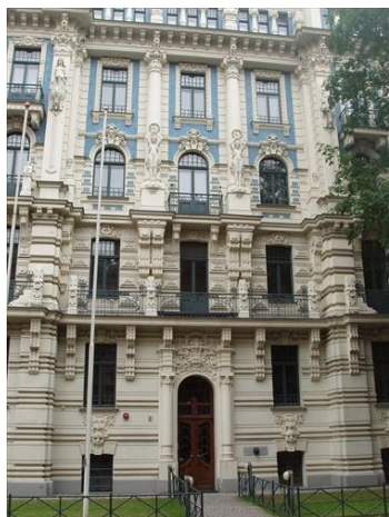
Priečelie secesnej budovy

Prvé prejavy modernizácie sa v Uhorsku objavujú už ..... Najviditeľnejším prejavom modernizácie života je ..... Pre nové stavby sú charakteristické ..... fasády, za ktorými sa však ukrýva ..... priestor. Tieto nové architektonické riešenia vystriedali ....., ktorá vzniká na prelome 19. a 20. storočia. Tento umelecký smer zasiahol okrem architektúry aj ostatné druhy umenia. Najcharakteristickejším znakom boli ozdobné ....., hlavne ..... motívy. Rozsiahle uplatnenie dosiahla secesia v ..... umení.