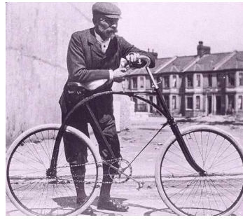
Cyklista zo začiatku 20. storočia