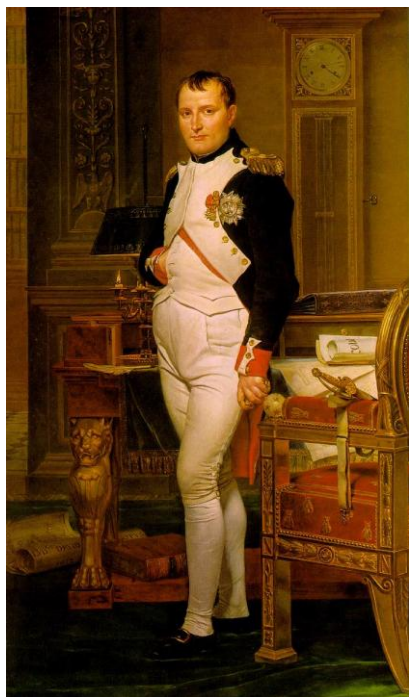
Napoleon I. Bonaparte

Po páde ..... diktatúry, ktorá sa skončila popravou ....., začalo Francúzsko vyhrávať aj vo vojne proti susedom. Vyhнали ich z krajiny a s ..... a ..... podpísali mier. V týchto bojoch sa vyznamenal ..... Aj napriek tomu pokračujú v Paríži nepokoje.