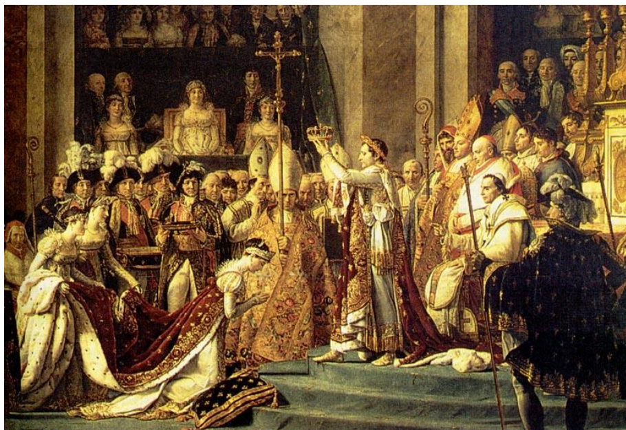
Korunovácia Napoleona a Jozefíny

Takto sa Francúzsko zmenilo z ..... na ..... Aj keď jeho vyhlásenie znamenalo krok späť,