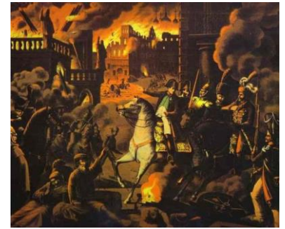
Napoleon v horiacej Moskve

....., ktorý mal vyriešiť situáciu po napoleonských vojnách. Jedným z výsledkov jeho rokovaní bol návrat francúzskych hraníc do stavu pred rokom 1789.