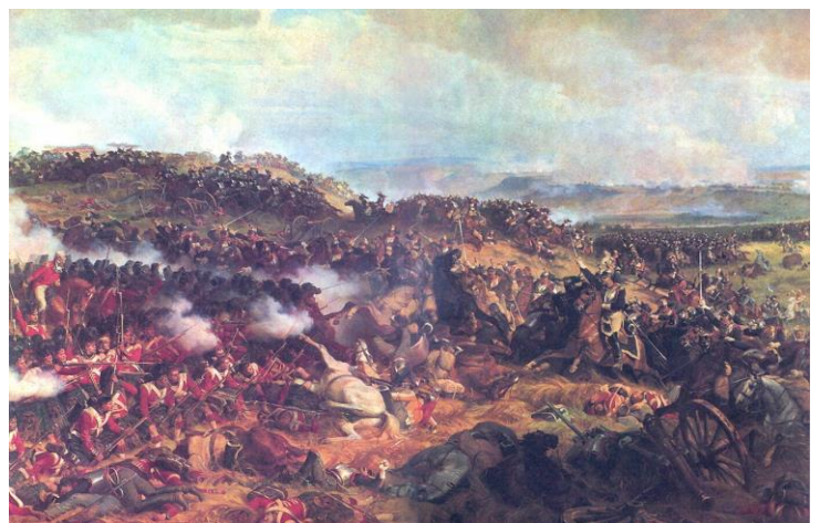
Bitka pri Waterloo