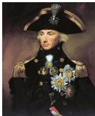
Admirál Horatio Nelson