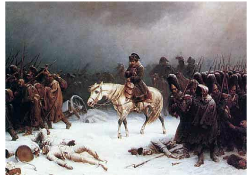
Ústup Veľkej armády z Ruska