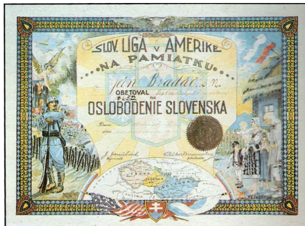
Pamätná ďakovná pohľadnica za príspevok na oslobodenie Slovenska

..... V čase posledných bojov 1. svetovej vojny sa predstavitelia Čechov a Slovákov opäť zamýšľali nad možným usporiadaním povojnových pomerov medzi Slovákami a Čechmi. Kým predošlý dokument koncipovali samotní emigranti v USA, autorom textu ..... z ..... bol domáci predstaviteľ Čechov (a Slovákov) v Európe - ..... 3 Krajania tento dokument len prijali a podpísali.