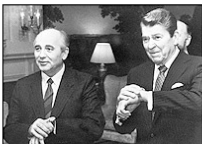
M. Gorbačov a R. Regan

V roku 1982 zomrel L. I. Brežnev , ktorého vo vedení KSSZ vystriedal bývalý šéf KGB Jurij V. Andropov . Andropov vystupoval ako opatrný reformátor , ktorý sa snažil obmedziť absentérstvo, alkoholizmus ale aj čierny trh. Počas svojej vlády bojoval proti byrokracii a snažil sa zvýšiť všeobecnú disciplínu. Významnou súčasťou jeho vlády bola kádrová politika , ktorou chcel dostať do vedenia strany mladšie kádre, nie Brežnevových „gerontokratov“.