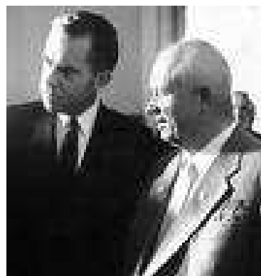
R. Nixon a N. S. Chruščov

Brežnev bol zástancom vlády silnej ruky, nie len v samotnom ZSSR, ale aj satelitných štátoch. 16 Okupáciou ČSSR stratil komunistický vládny systém aj posledných svojich prívržencov, ktorí ešte dúfali v jeho zmenu a pretvorenie na liberálnych a demokratických princípoch. Po okupácii nastáva v celom Východnom bloku stagnácia systému, ktorá je onedlho zastavená procesom normalizácie. Aj napriek nastupujúcej normalizácii sa k slovu hlási otvorený alebo skrytý disent 17 , ktorý 1. kritizoval samotný