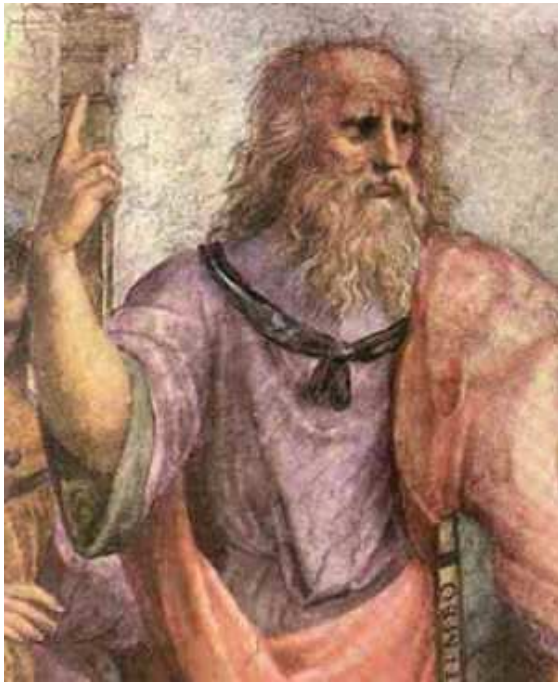
Platón, detail obrazu Aténska škola (Rafaelo, 1509 – 1510)

Platón pochádzal z významnej aristokratickej rodiny. Pôvodne sa volal Aristoklés, ale pre jeho atletickú postavu so širokými ramenami ho začali volať Platón 1 . Jeho pôvod mu zabezpečil výborné vzdelanie potrebné pre aktívnu účasť v politickom živote Atén. Platón bojoval v Peloponézskej vojne a po jej skončení sa stal na istú chvíľu jedným z tridsiatich tyranov, ktorí sa ujali vlády. Kvôli rozporom so strýkom Charmenidom 2 a aj po prehrešku Aténčanov proti filozofii (ako to neskôr pomenoval Aristoteles) popravou Sokrata, vzdal sa