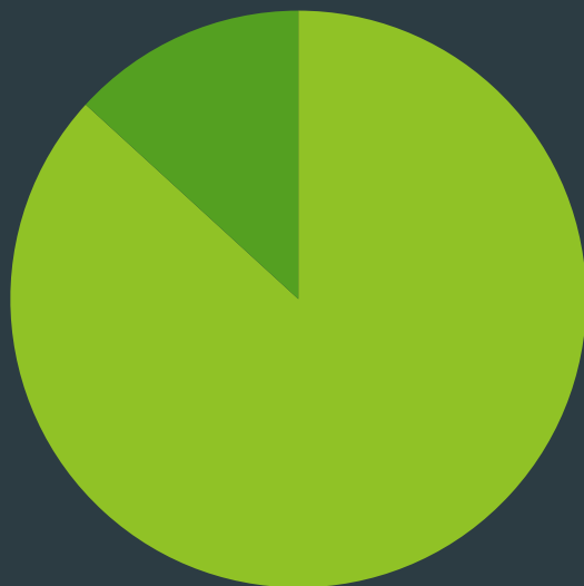
Ľudia pod 45 rokov