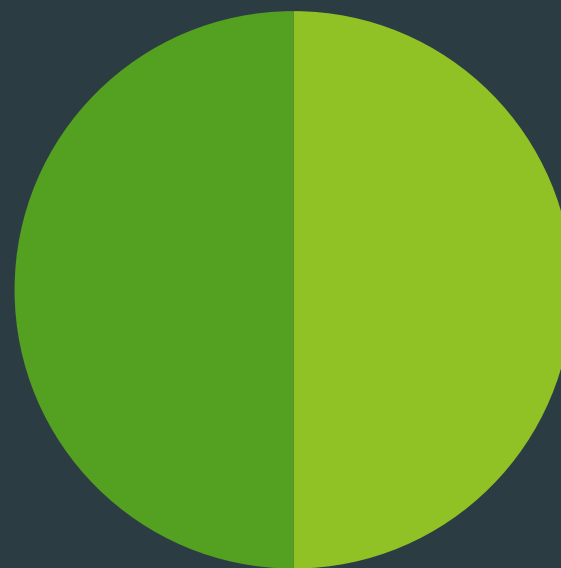
Ľudia nad 45 rokov