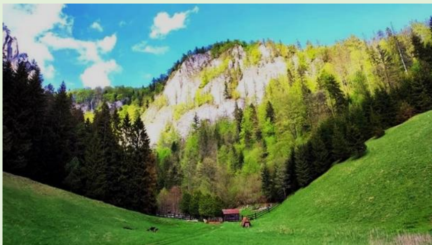
Názov: Dolina v tvare U Lokalita: Stratenský kaňon Dátum: 21. 5. 2022