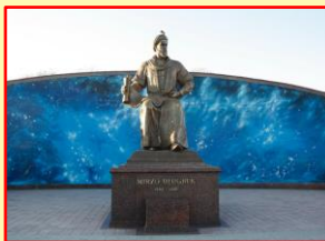
Socha zakladateľa tejto hvezdárne – Mirzo Ulugbek.