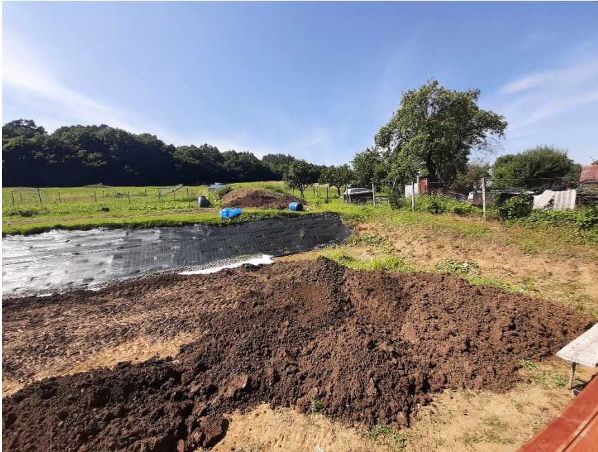
Autor: Filip Vavrek Dátum: 8. 2021 Lokácia: Gregorovce