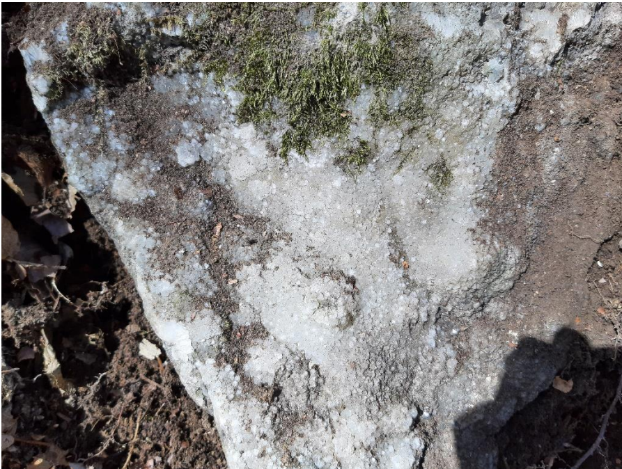
Autor: Filip Vavrek Dátum: 4. 2022 Lokácia: Banská Štiavnica