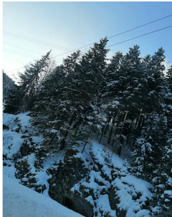
Dátum: 1. 2020 Lokácia: Donavaly