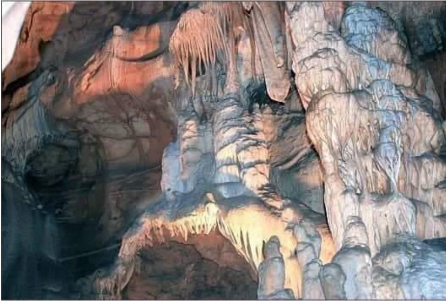
Autor: Eva Vavreková Dátum: 3. 2016 Lokácia: Harmanec