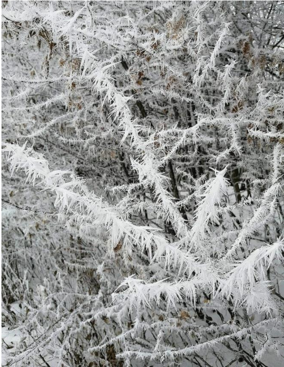
Autor: Filip Vavrek Dátum: 1. 2020 Lokácia: Gregorovce