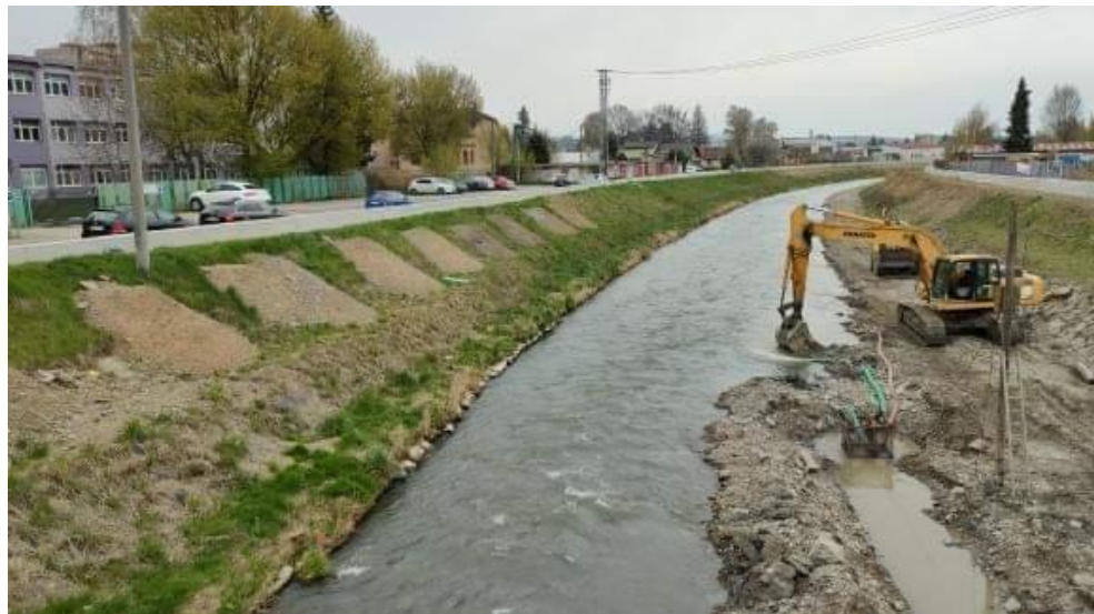
Autor: Ján Kolesár Dátum: 5. 2022 Lokácia: zárez stravného potoka