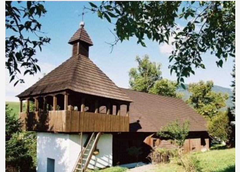
Drevený kostol v Istebnom