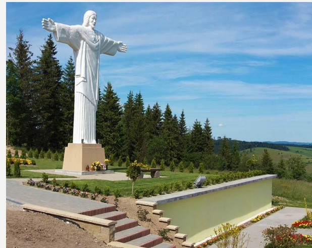
Socha Krista v Kline