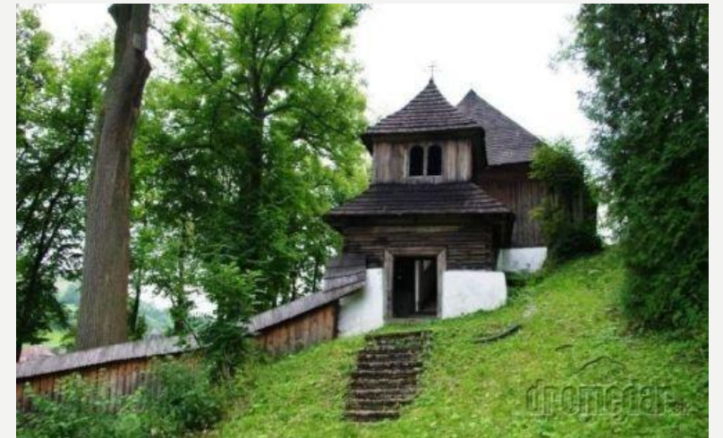
Drevený kostol v Leštínách