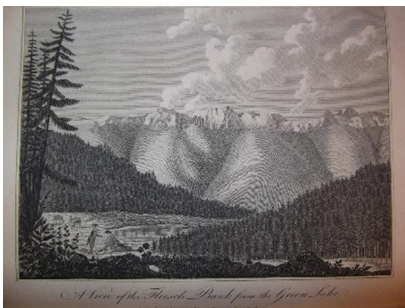
Obr. 1 Výhľad na Tatry v Diele Cesta po Uhorsku