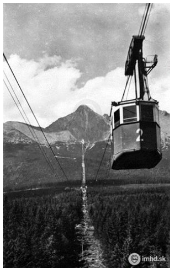
Obr.2 Visutá lanovka 13)

Slávnostné otvorenie sa konalo v roku 1941. Trasa lanovky má dve časti: z Tatranskej Lomnice na Skalnaté pleso s medzistanicou Štart, ktorá v minulosti plnila štartovaciu funkciu pre sánkarskú a bobovú dráhu. 12)