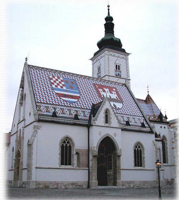
kostol sv. Marka