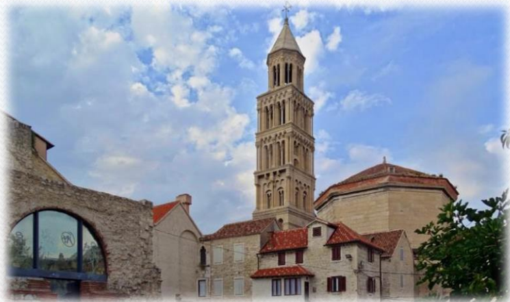
Katedrála v Splite